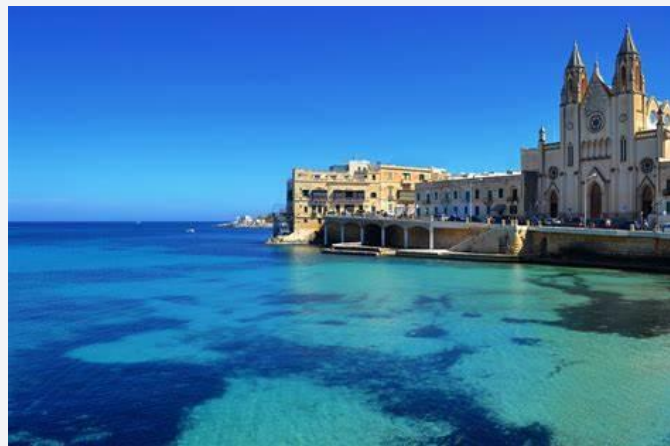
Une côte rocheuse de Malte avec une mer d'un bleu profond.

Fauteuil roulant possible. Activités variées comme plages, tours en bateau, visites de forteresses.