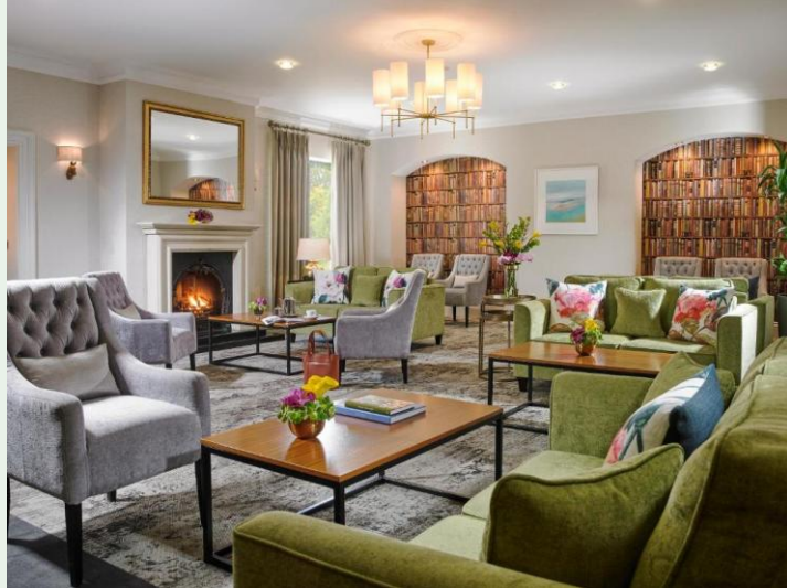
Un pub irlandais traditionnel et chaleureux.

En hôtel cosy à Clonakilty, avec tour de la Côte Sauvage, randonnées et restaurants.