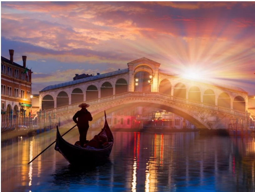
Une gondole sur un canal à Venise.

Hébergement dans le centre historique, idéal pour les couples. Le transport est facile.