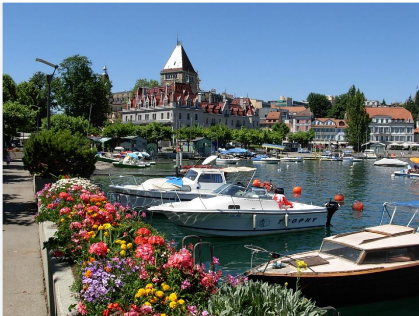
Un lac suisse entouré de montagnes.

En bord de lac, avec excursions en train et randonnées pour tous les niveaux.