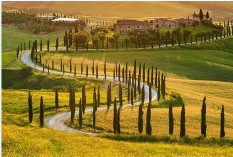
Un paysage toscan avec des cyprès.

Visite de Florence, Pise, Lucques, avec hébergement en hôtel ou gîte.